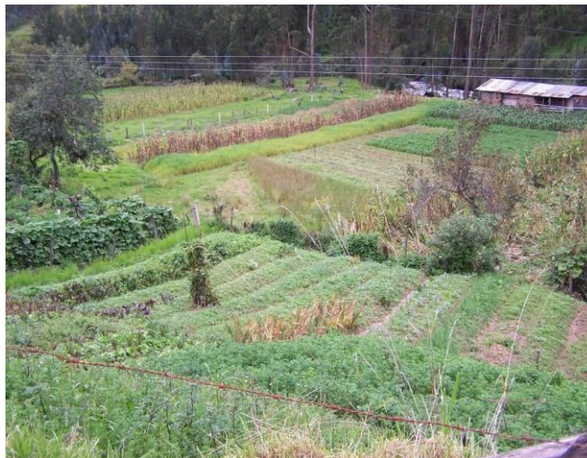
Huertos Familiares.

trucha ha beneficiado de alguna manera a los que se dedican a la venta y comercialización del mencionado producto. (Plan de Desarrollo de la Parroquia Sayausí-Descripción del Proceso y Metodología, 2003; Proforestal.)