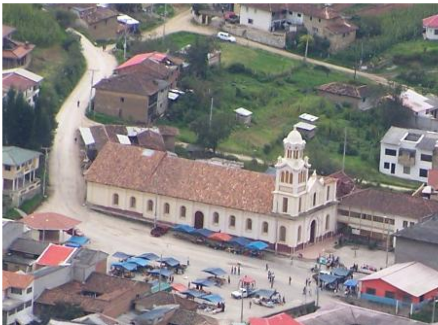
Iglesia de Sayausí con su plaza central.