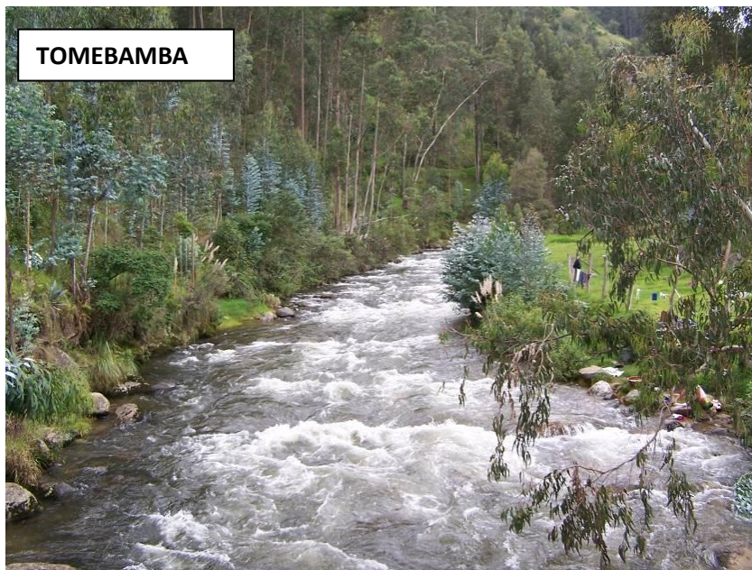
Río Tomebamba y sus afluentes.