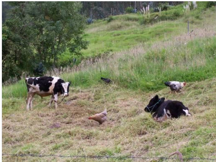
Flora y fauna de la Parroquia Sayausí.