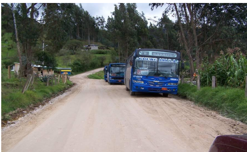
Transporte de la parroquia Sayausí.

En toda la parroquia se sintoniza la radio, televisión, el periódico llega todos los días, actualmente cuentan con servicio de correo y encomiendas. Y hoy en día los avances tecnológicos han permitido que la población cuente con el servicio de internet en los distintos café nets del sector y en mínima cantidad en sus propios hogares. Además que el servicio de celular abarca a casi toda la población mayor de 15 años.