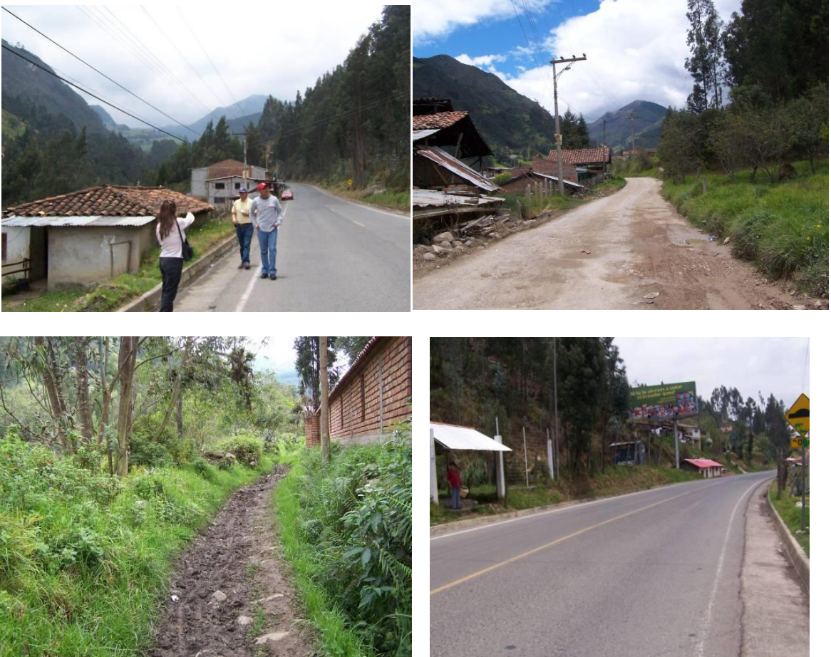
Caminos de la Parroquia Sayausí

La avenida Ordóñez Laso es la principal arteria vial que une a Sayausí con Cuenca, asfaltada en su totalidad. Otra arteria vial es la carretera Cuenca – Molleturo por la parroquia San Joaquín y se une con la Y a la avenida Ordóñez Lasso. Otra vía es la avenida de El Tejar todavía en construcción. Las vías secundarias son aquellas que comunican a los barrios de la parroquia entre si y se encuentran en mal estado ya que son vías de tercer orden.