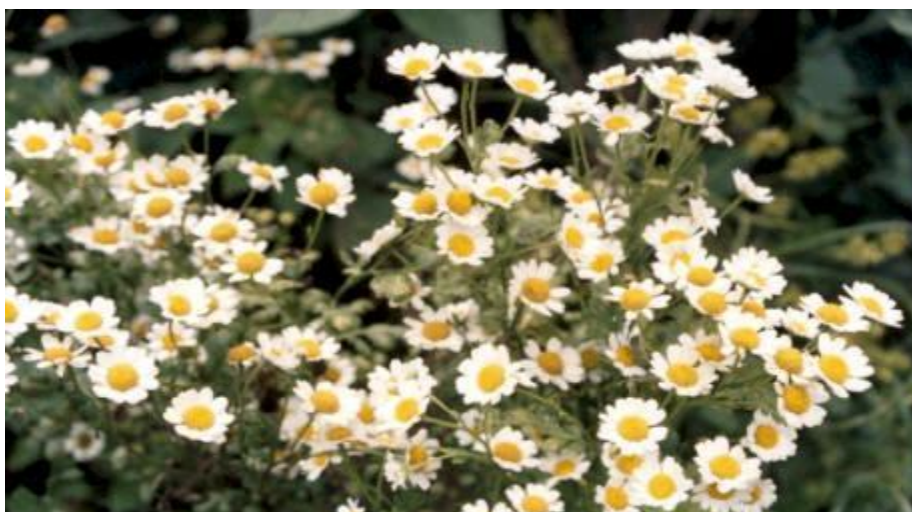
Planta de Santa María.

El nombre de Santa María se origina con la llegada de los carros que realizaban el transporte de pasajeros desde Cuenca hasta lo que hoy es Santa María en el sitio donde se hacía la parada de autobuses; en esta zona existía gran cantidad de plantas medicinales entre las que se encontraban en su mayoría la Santa María que es utilizada para curar el espanto, dolores menstruales, artritis reumatoide, migrañas, cólicos, favorece la menstruación, baja las fiebres, histeria, decaimiento, catarro, indigestión, diarrea, aires, espantos y repelente de insectos. Además se pueden destacar la presencia de otras plantas medicinales como ataco, toronjil, violetas, manzanilla, pena pena, hierba luisa, chichira, llantén, hierba buena, menta, cedrón, entre otras.