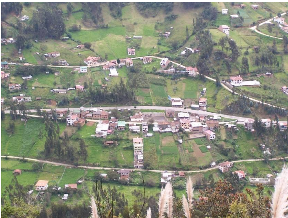
Vista panorámica de Sayausí

Sus pobladores han mostrado una sorprendente capacidad de emprendimiento y servicio comunitario hasta el punto de ver forjado valiosas iniciativas para la comunidad, como es la creación de la Cooperativa de Ahorro y Crédito Juventud Ecuatoriana Progresista, que constituye uno de los hitos más importantes del desarrollo de este pueblo y que es de vital importancia para su progreso. De la misma manera han incursionado en el campo educativo, tal es el caso preponderante del colegio Javeriano, que ha creado profesionales en el sector agronómico y veterinario, que han motivado cambios importantes en la calidad de vida de sus pobladores.