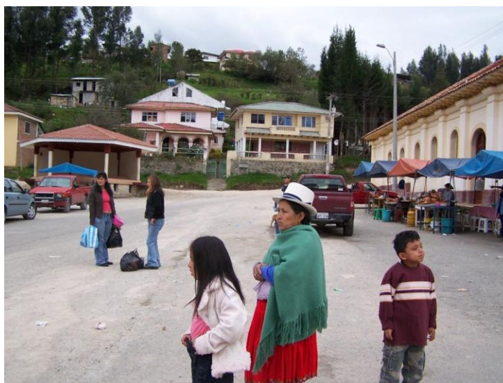
Vestimenta Tradicional de Mujer.

La juventud casi ya no usa este tipo de vestimenta solo en la elección de la cholita sayauseña en las fiestas de San Pedro, las candidatas usan dicho atuendo