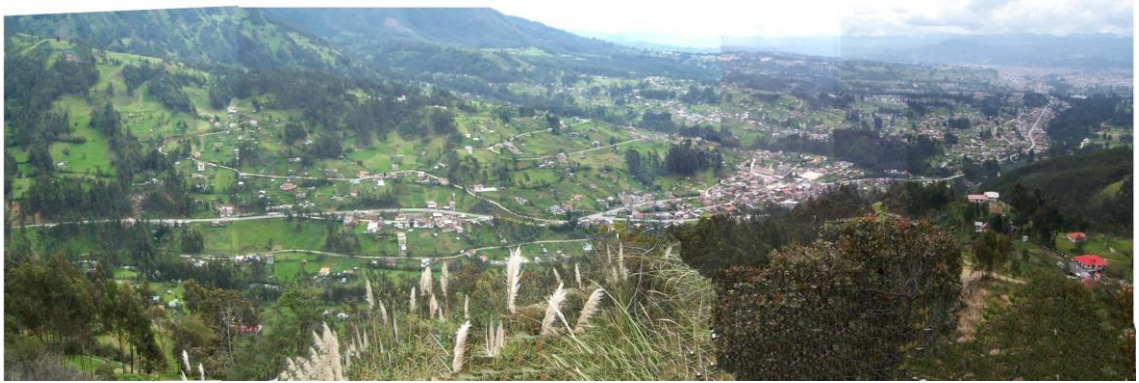
Vista panorámica de la orografía de Sayausí.