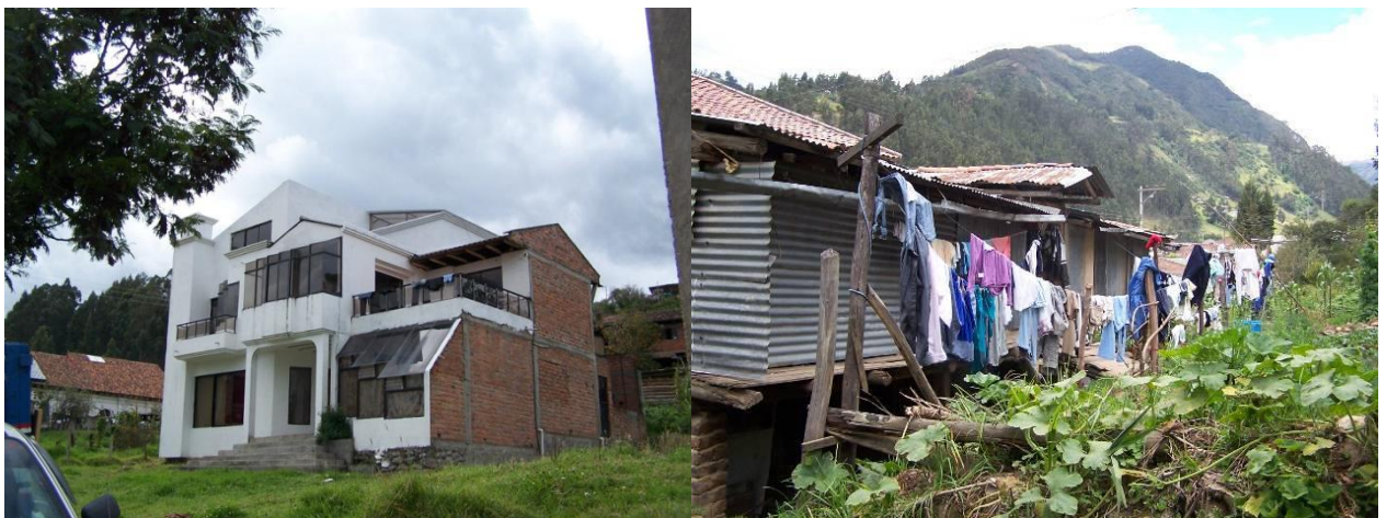
Tipos de Vivienda en Sayausí.

INTERPRETACION: De los hogares visitados, el 93% poseen servicio de luz eléctrica, el 73% cuenta con agua entubada, el 32% de las casas posee agua potable y el 5% de los hogares dispone de los 2 tipos de aguas, el 35% de la población cuenta con alcantarillado y el 27.9% posee servicio telefónico.