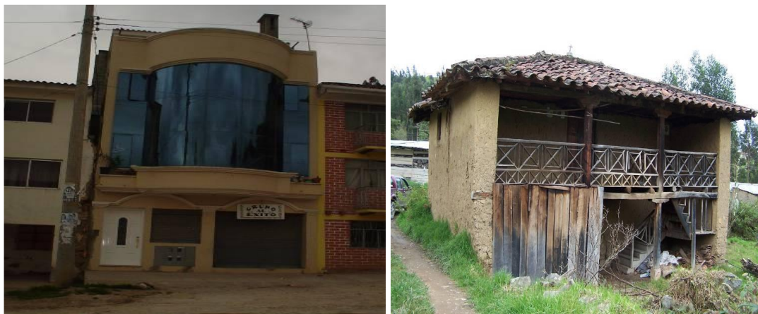
Tipos de vivienda en la parroquia Sayausí